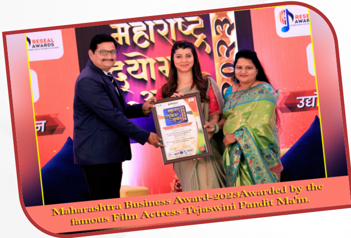
Maharashtra Business Award-2023 Awarded by the famous Film Actress Tejaswini Pandit Ma'am.